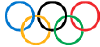
ബ്രിസ്ബൻ - ആസ്ട്രേലിയ

2023 ലെ ഇന്റർനാഷണൽ ഒളിമ്പിക് കമ്മിറ്റി സെഷന്റെ വേദി - മുംബൈ